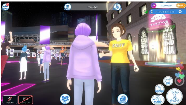
イベント会場を歩くアバターのイメージ

本イベントには、専用アプリ「HH cross EVENTS」からログインした上で、アバターを通じてご参加いただきます。アバターは、服装・髪型・アクセサリ等のパーツをカスタマイズすることができ、会場内をゲーム感覚で自由に歩き回っていただけます。また、ボイスチャットやテキストチャットの機能により周囲の方とコミュニケーションがとれるほか、バーチャルアイテムの「花火」を打ち上げて、コンサートの盛り上がりを演出していただけます。