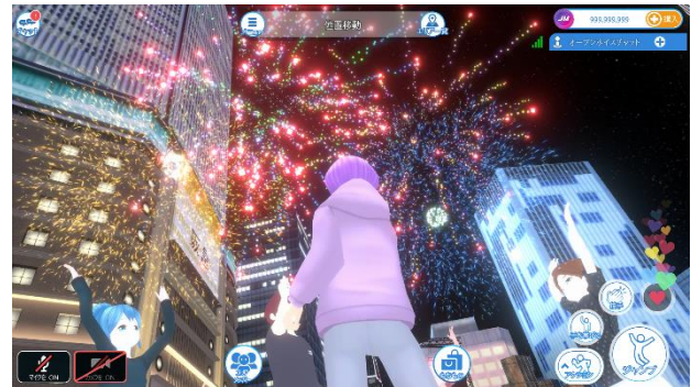
バーチャルアイテム「花火」のイメージ