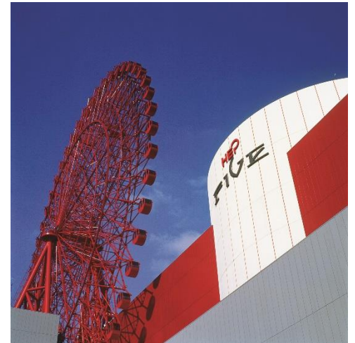
HEP FIVE の外観

https://www.hepfive.jp/lp/seventeenthecity_hepfive/index.html