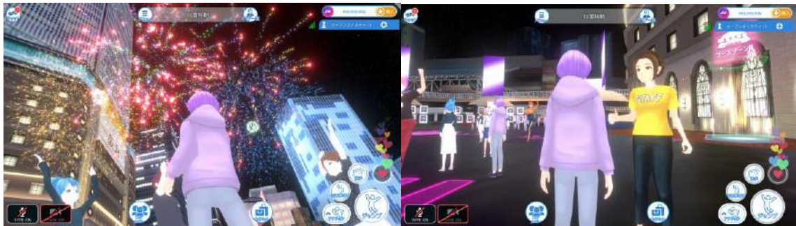
イベント会場を歩くアバターのイメージ

さらに、今回から、服装・髪型・アクセサリ等のパーツをカスタマイズしてオリジナルのアバターを作成することができるようになったほか、新機能のバーチャルアイテム「花火」により、参加者ご自身でもライブの盛り上がりを演出していただけます。