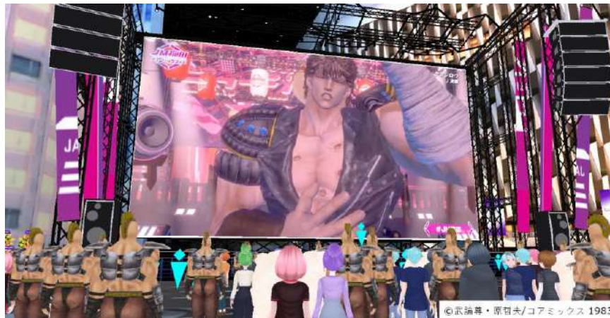
3月に開催した「JM 梅田ミュージックフェス (β)」のメインライブ