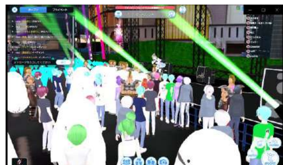
メタバース路上ライブのイメージ