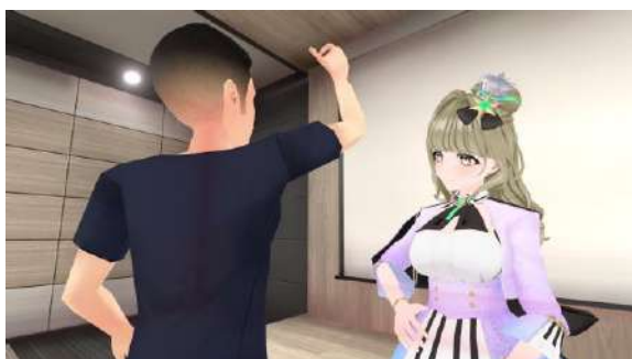
バーチャル握手会のイメージ

出演者とのバーチャル握手会やトークショー、メタバース路上ライブ等を実施する予定です。また、フォトスポットでは、自撮り機能を用いて出演者の写真パネルと記念撮影をすることができます。さらに、街歩きをするバーチャルアーティストとメタバース上でコミュニケーションをとることも可能です。