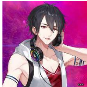
夢追翔 (にじさんじ)