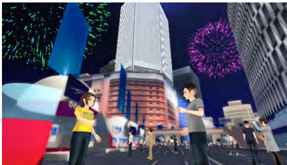
アバター目線のイメージ