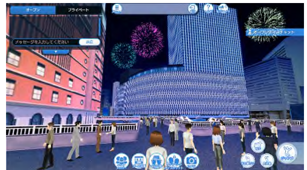
アバター操作画面のイメージ